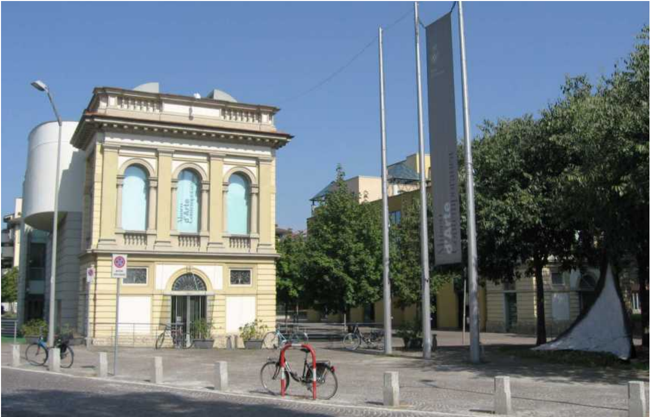
Piazzale della Stazione