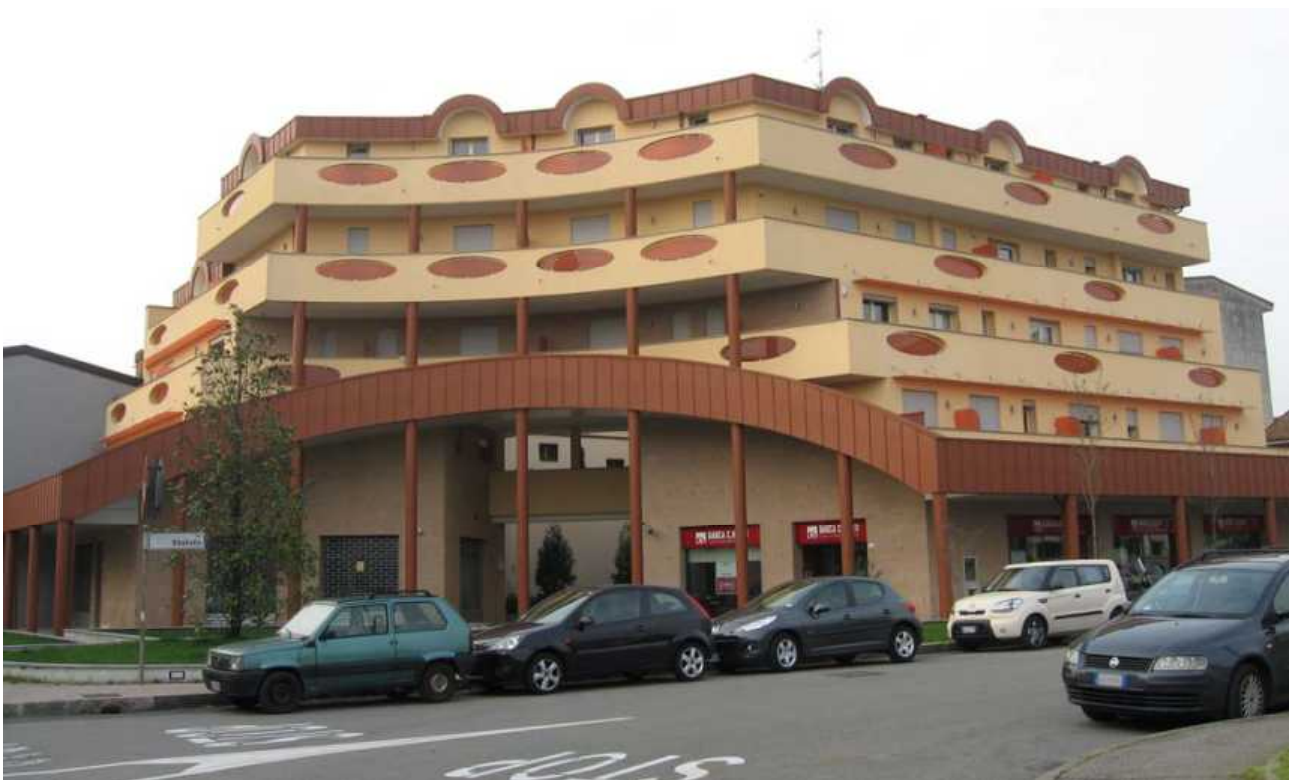
Via Matteotti, via Statuto