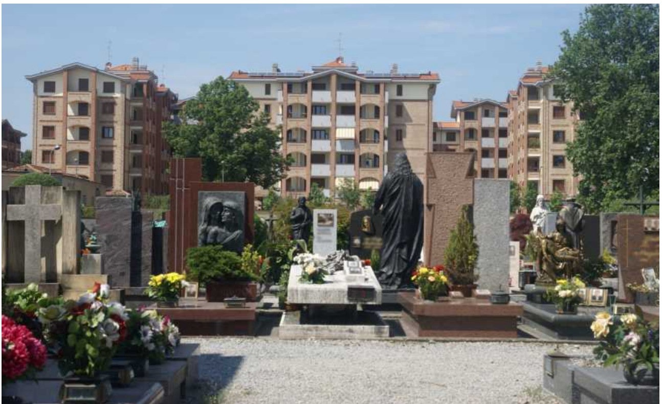
Cimitero di Lissone