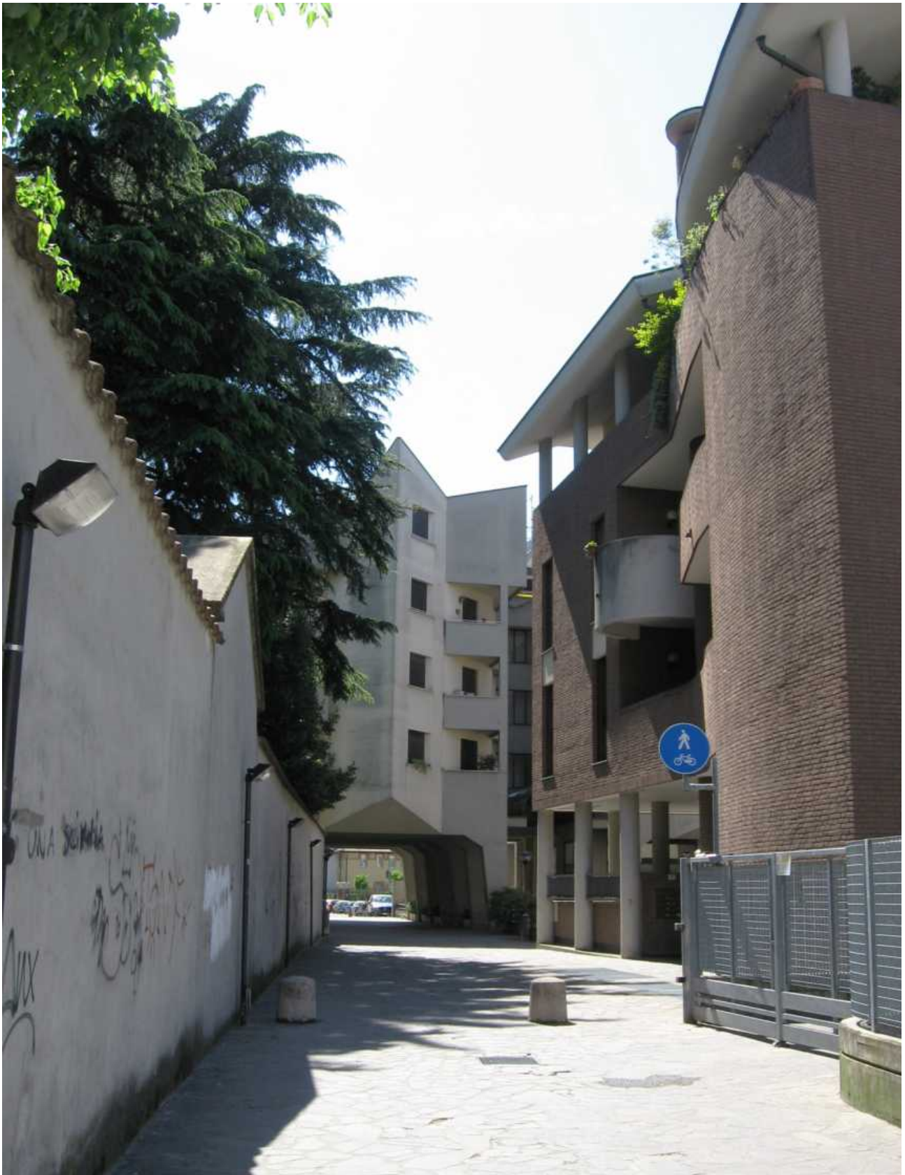
Via Sant' Ambrogio