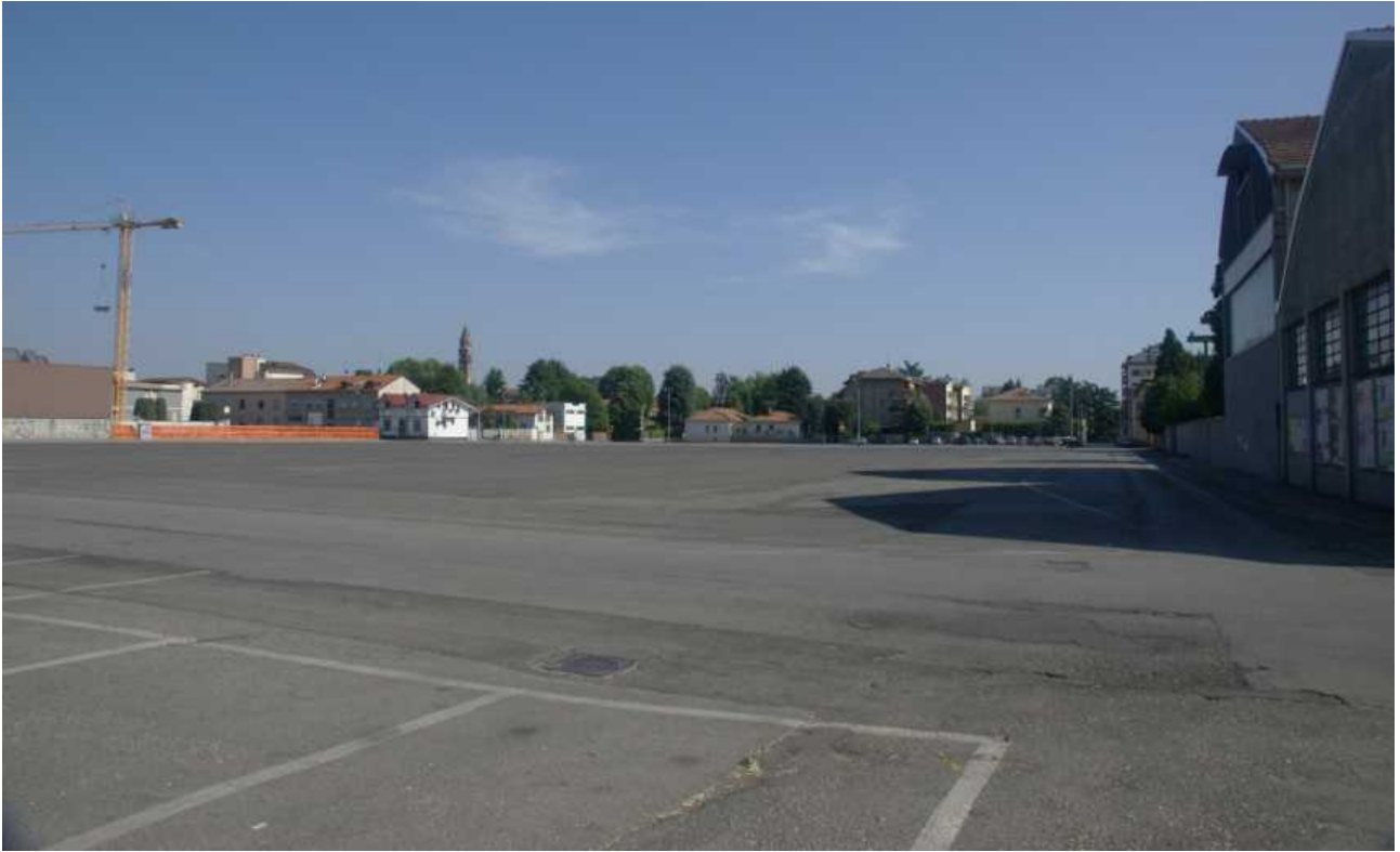
Piazzale degli Umiliati