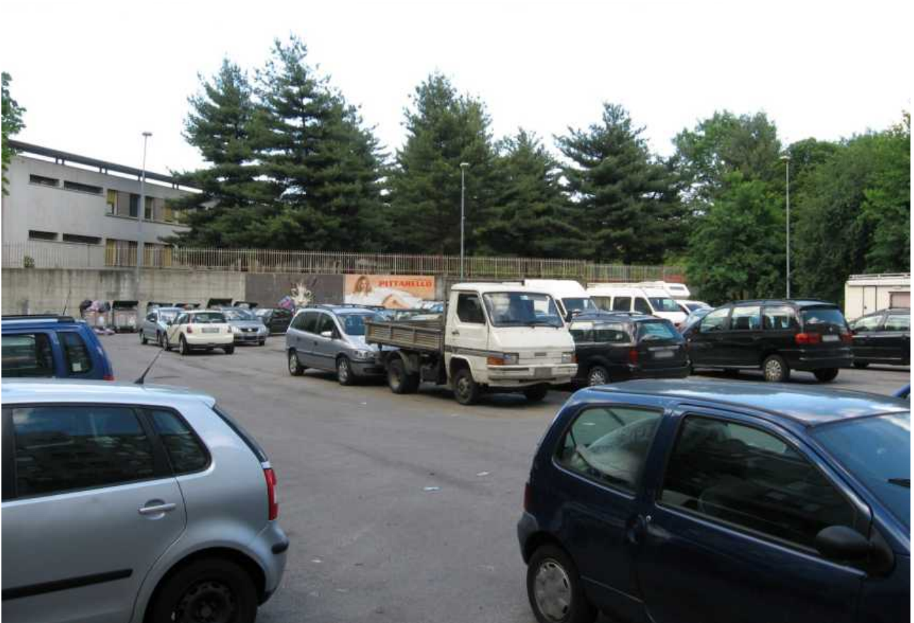
Via dei Gelsi, via dei Ciliegi