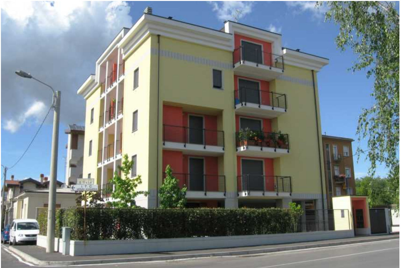
Via Gola, via Segantini