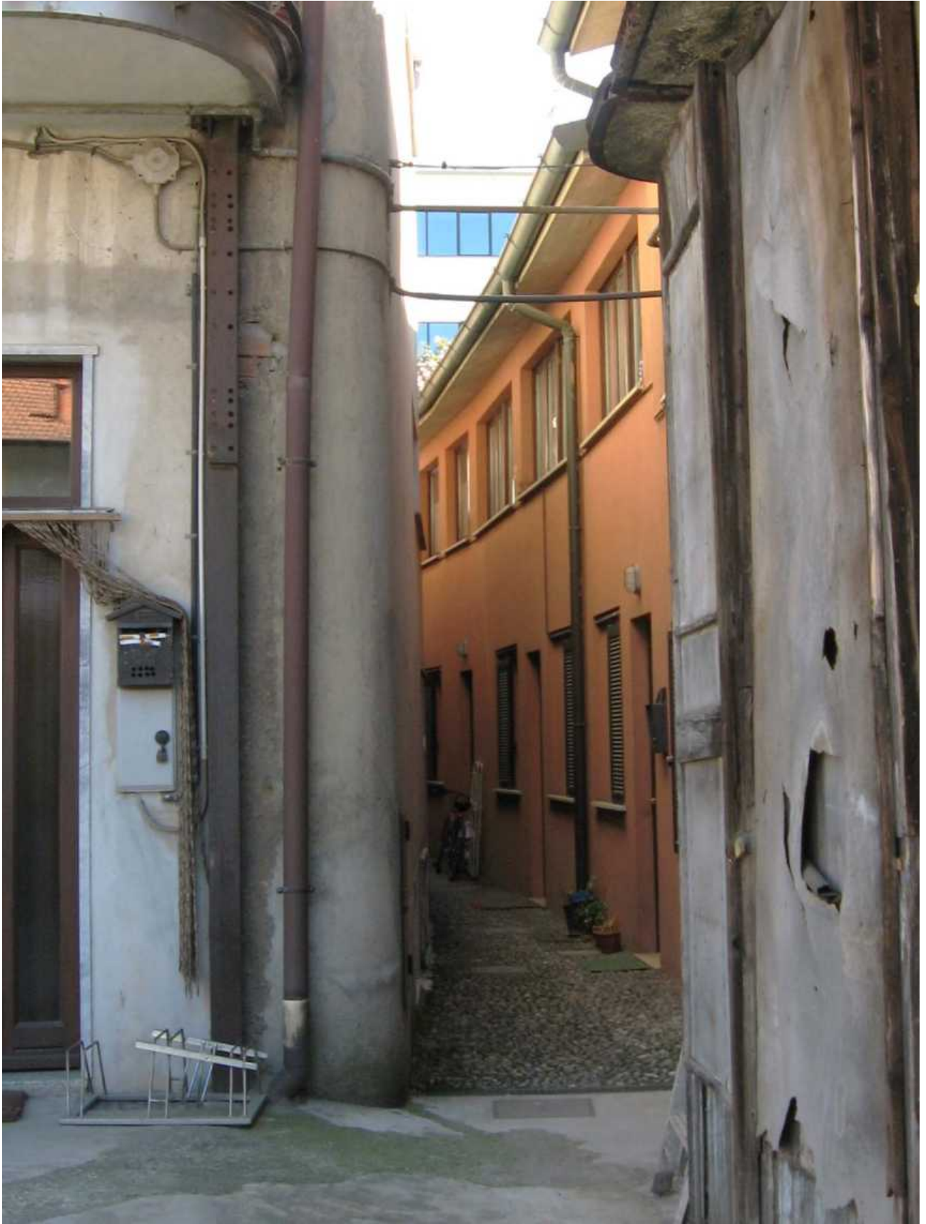
Corte in via Verri