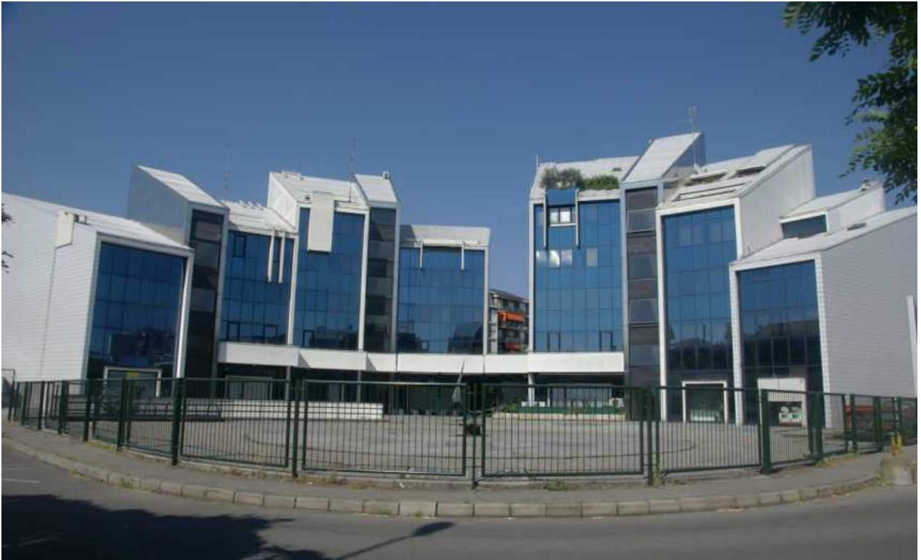
Via Matteotti, via Alighieri