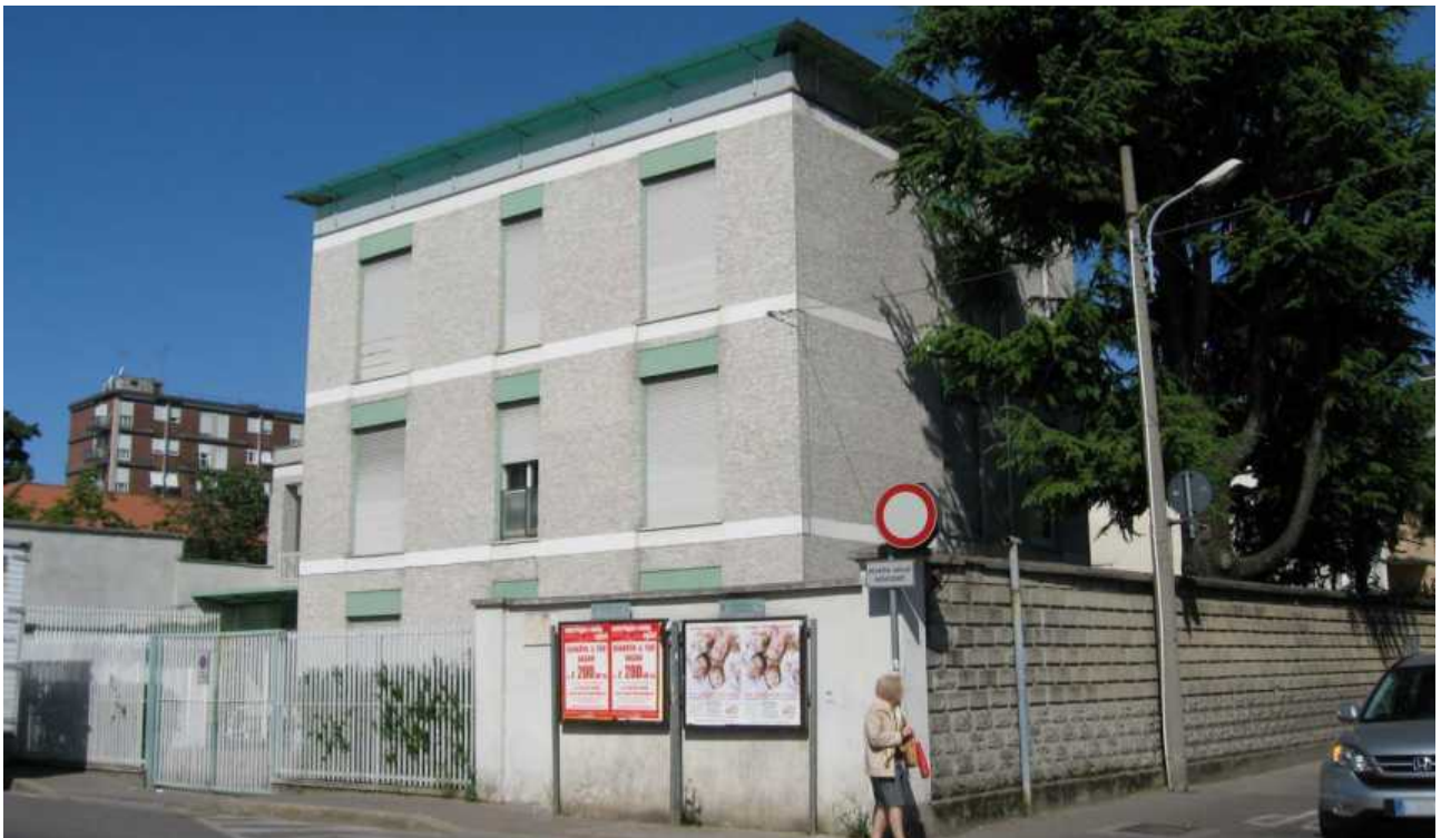
Via Verri, via Garibaldi