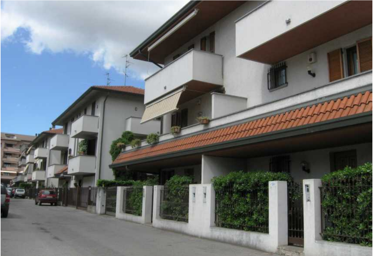
Via Don Gnocchi