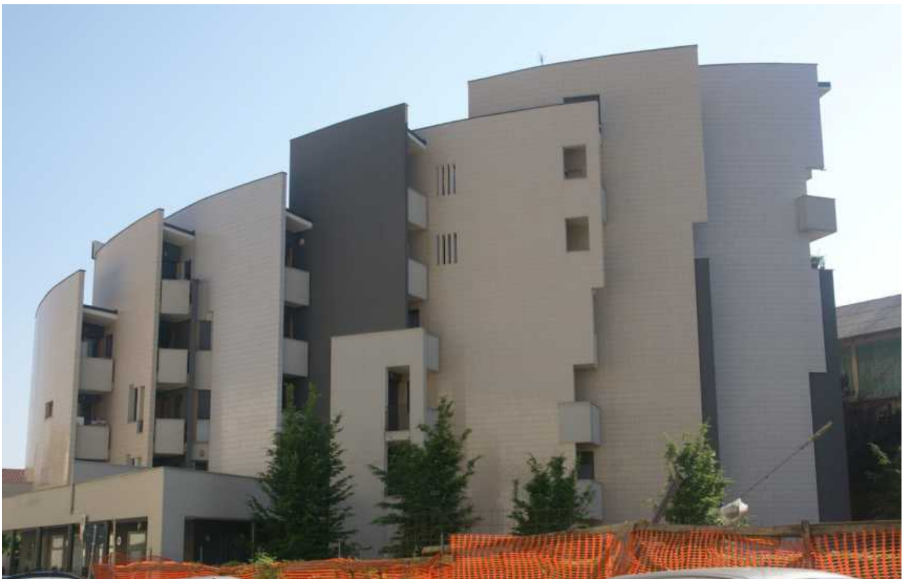
Via San Martino