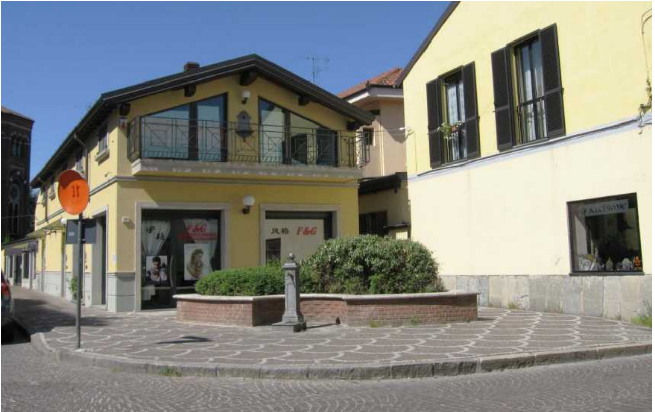
Via Don Minzoni, via Lega Lombarda