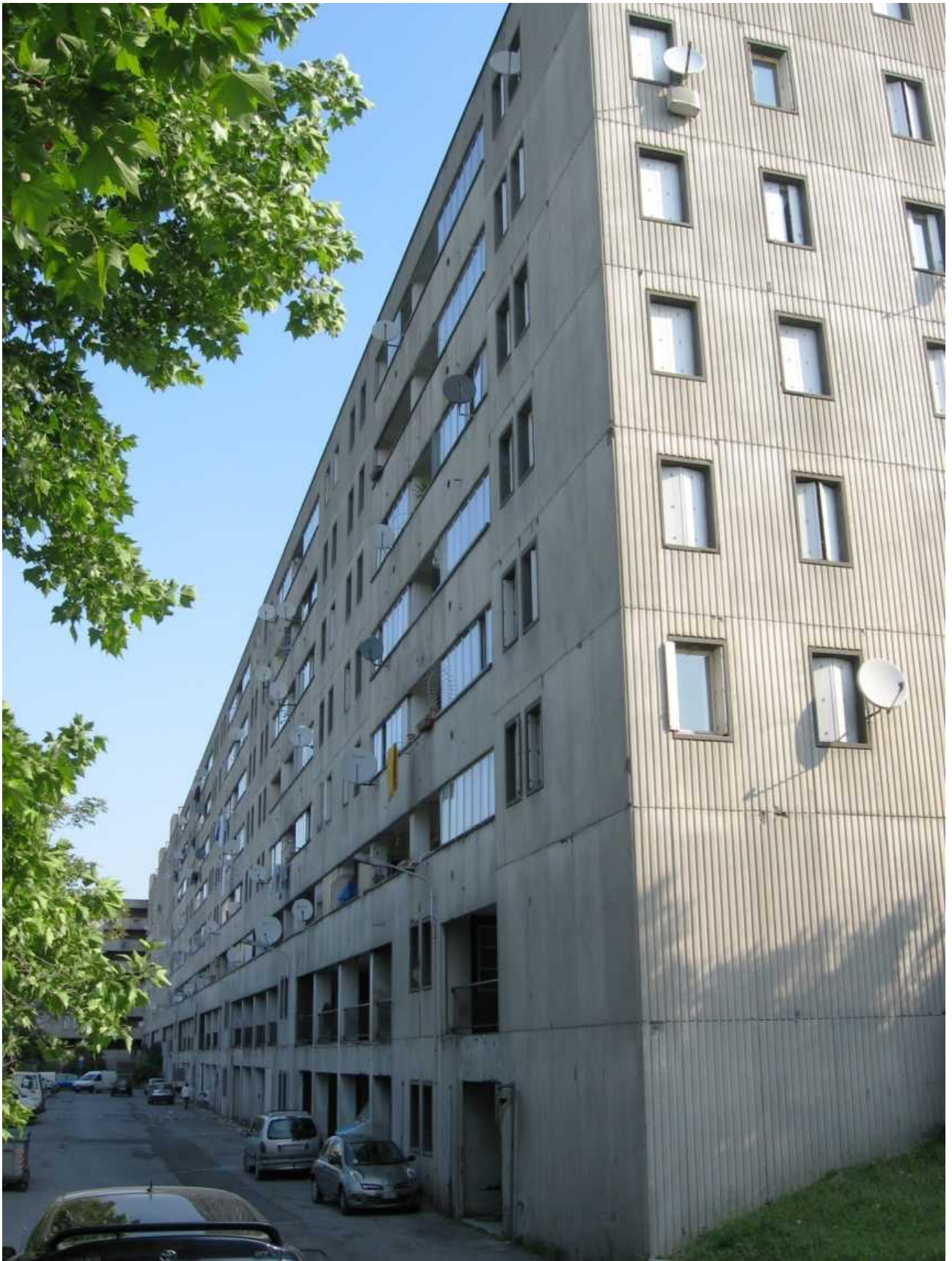
Via dei Gelsi