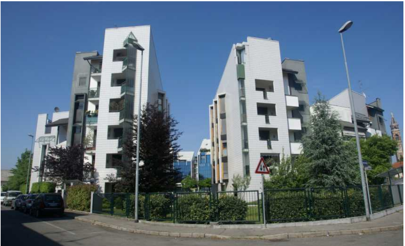
Via Statuto, via dei Mille