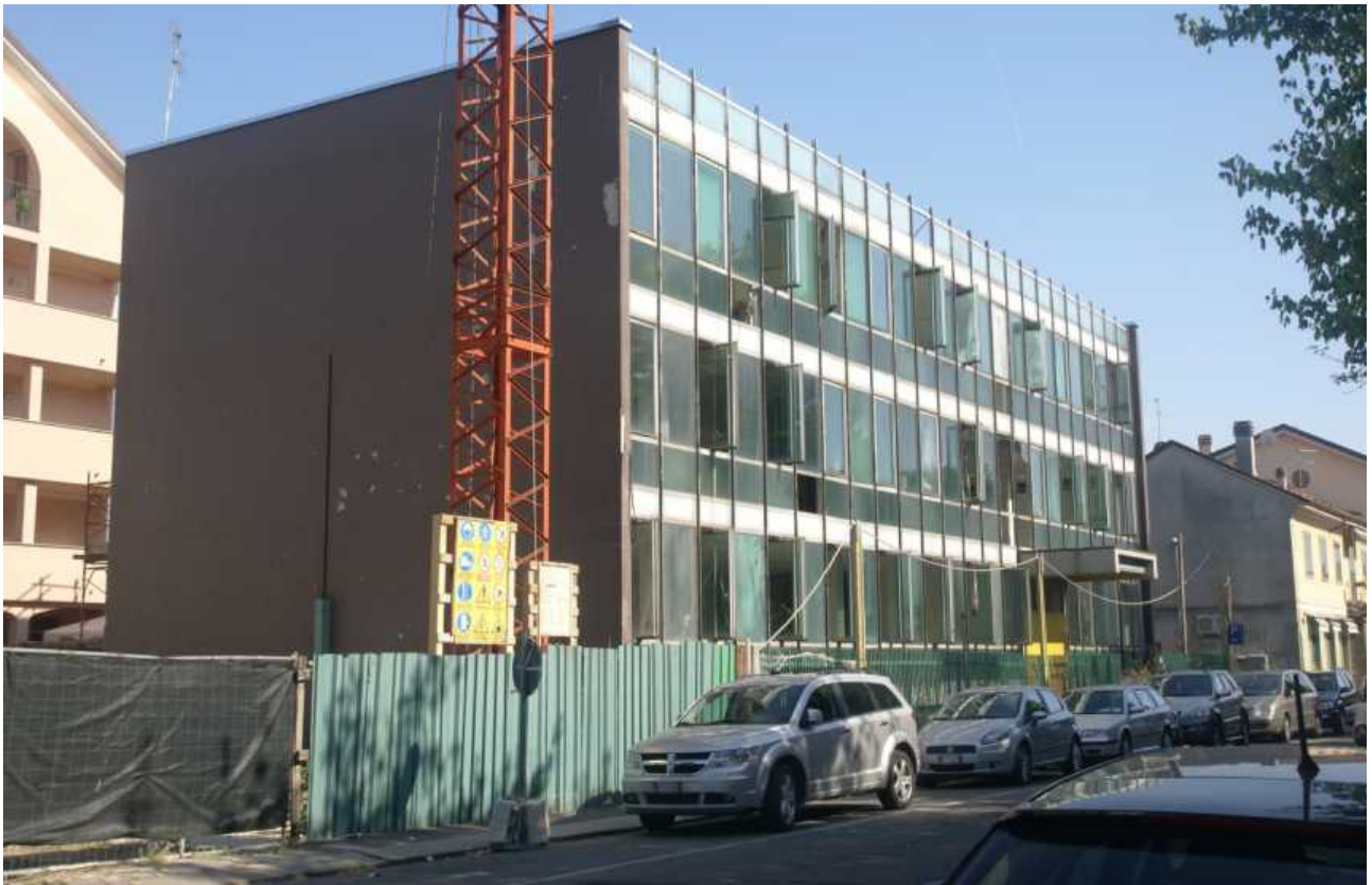
Via Don Minzoni