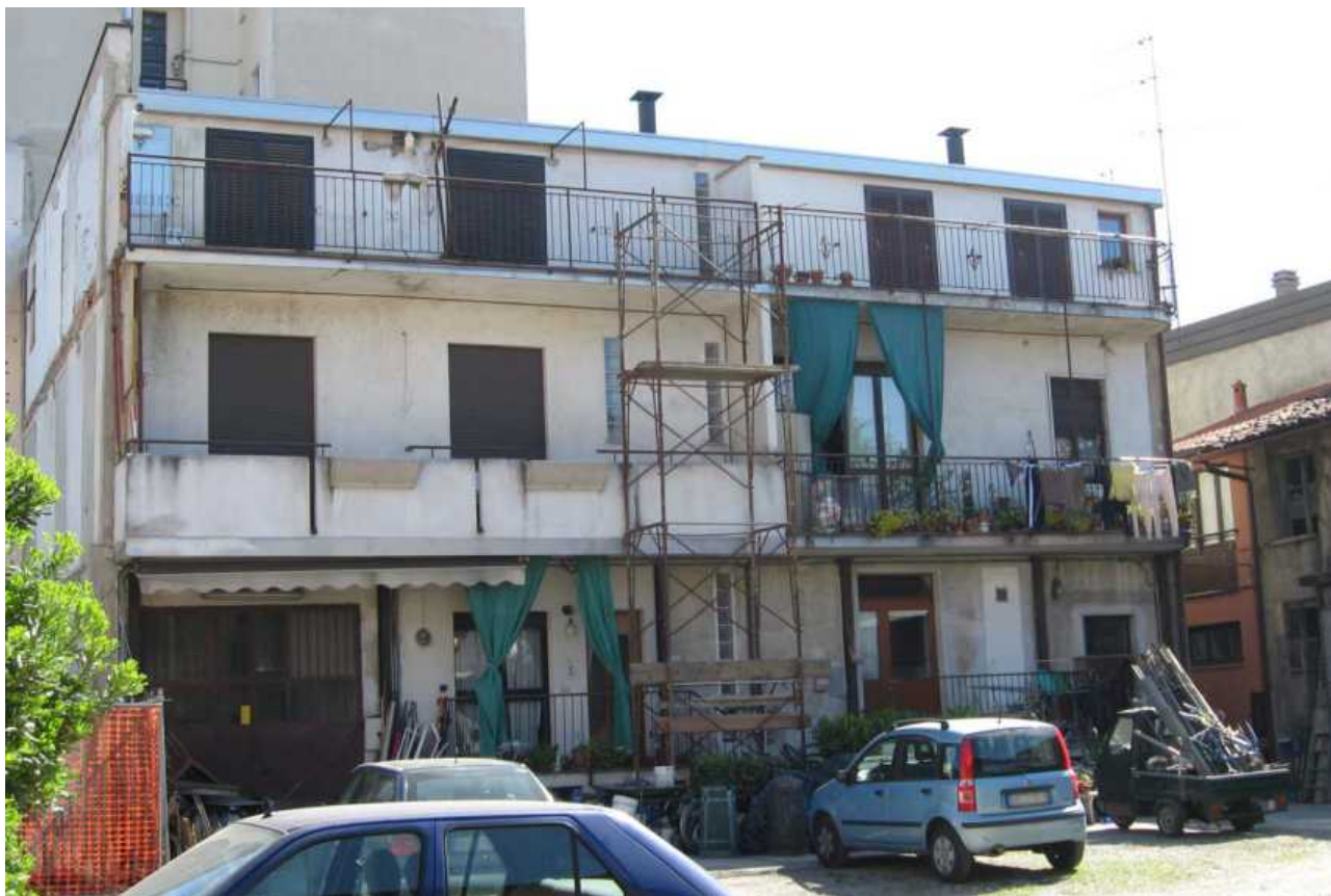
Corte in via Verri