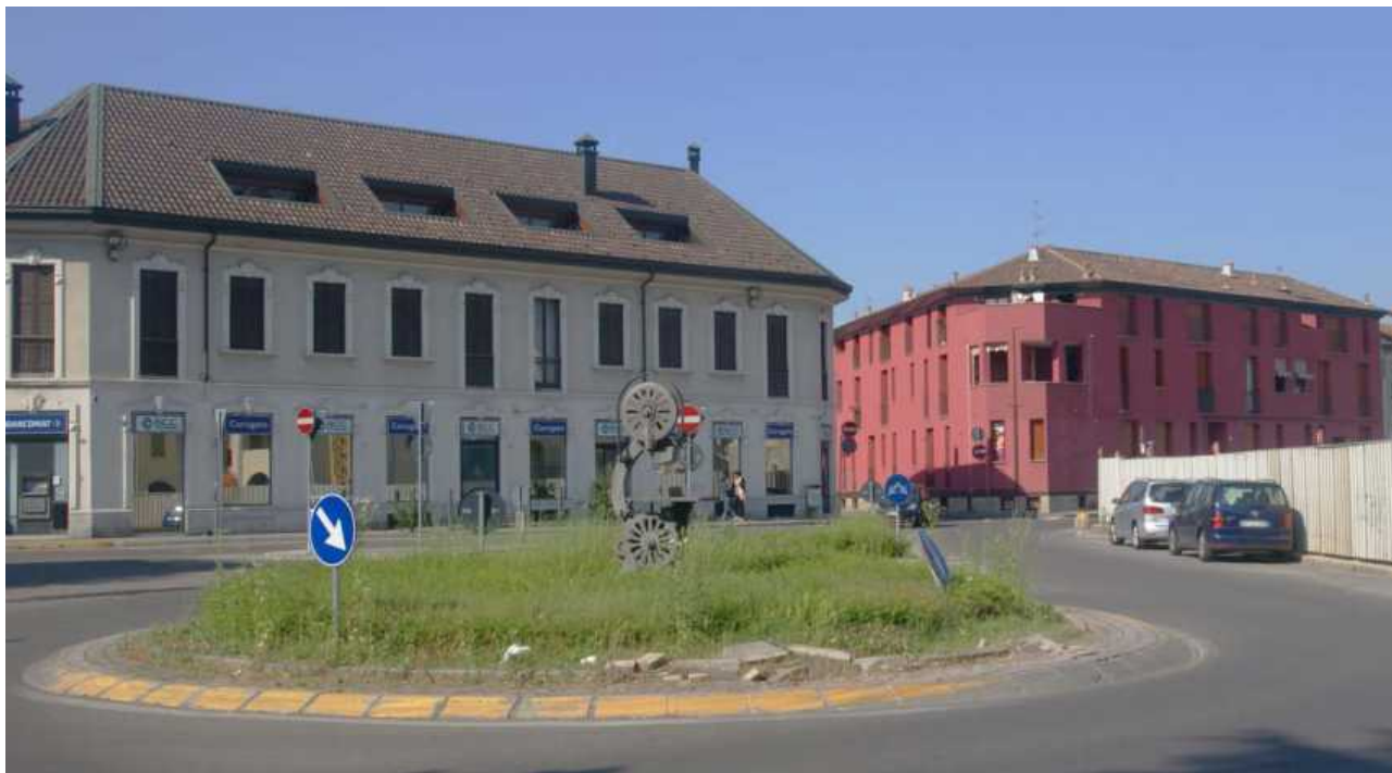
Via San Francesco d'Assisi, via Don Minzoni

Tessuti tradizionali e misti residenziali/produttivi, alcuni ristrutturati di recente