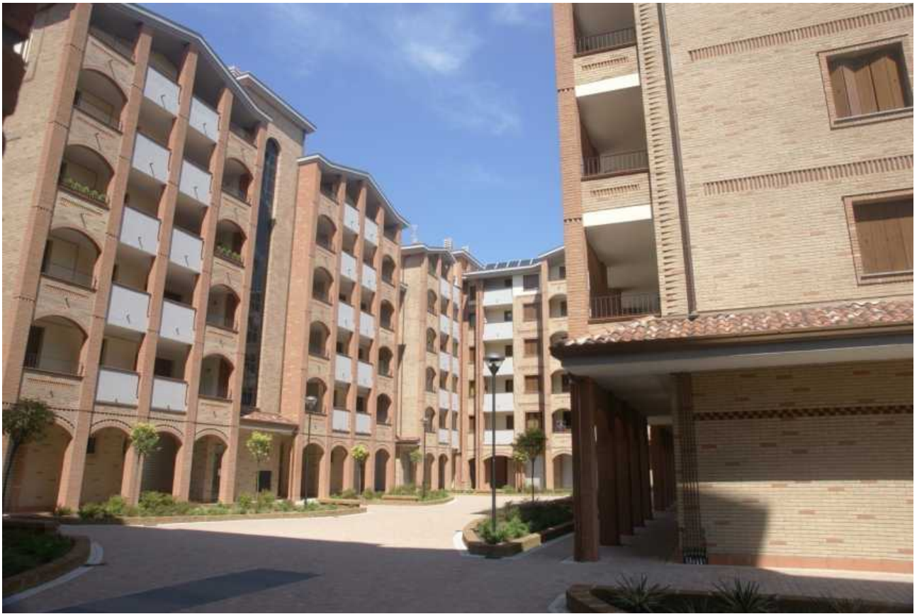
Via Cattaneo, via Sant'Agnese