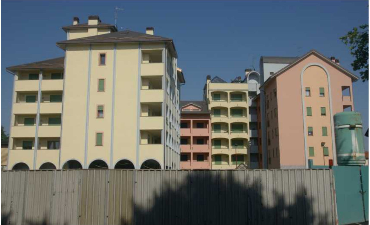
Via Don Minzoni