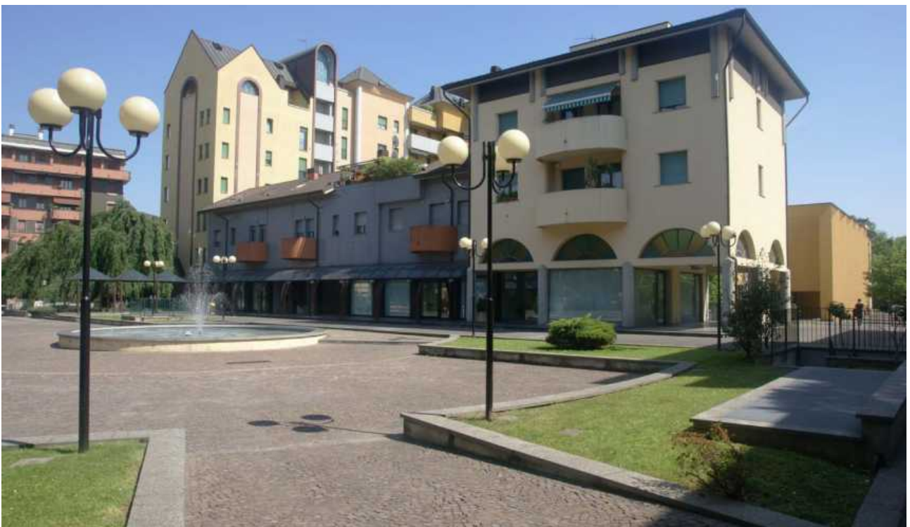
Piazza La Pira