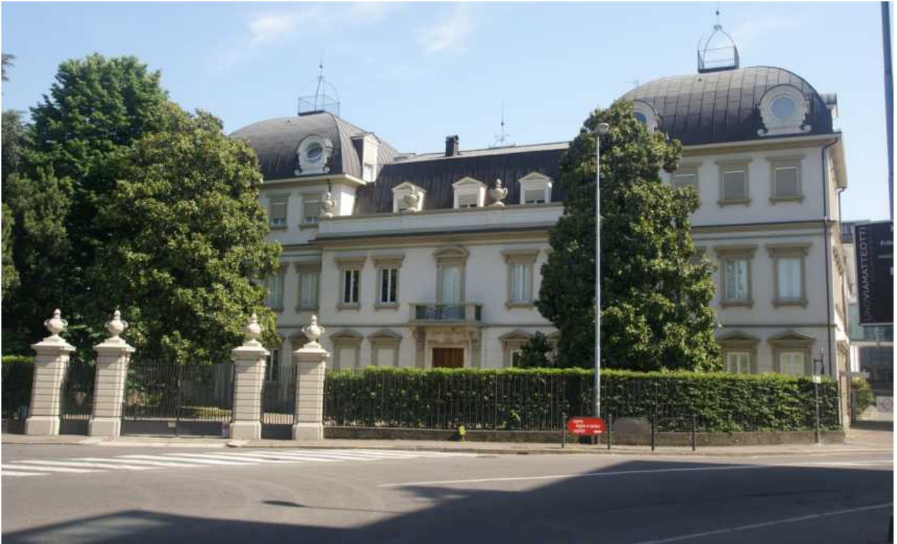
Via Giuliani, via Carducci