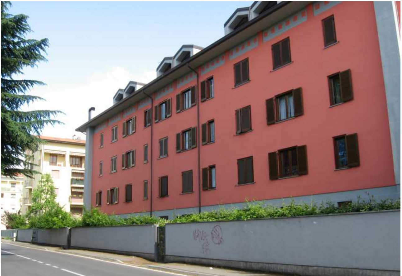
Via San Francesco d'Assisi