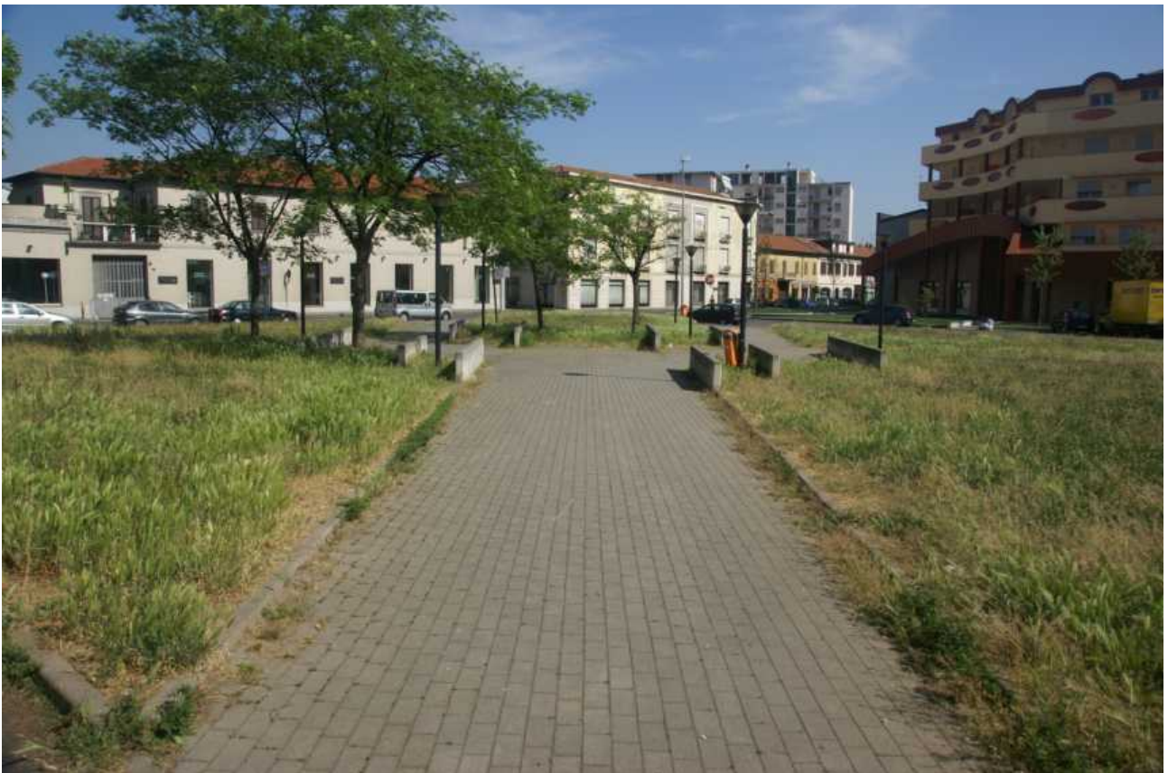
Via Matteotti, via Statuto