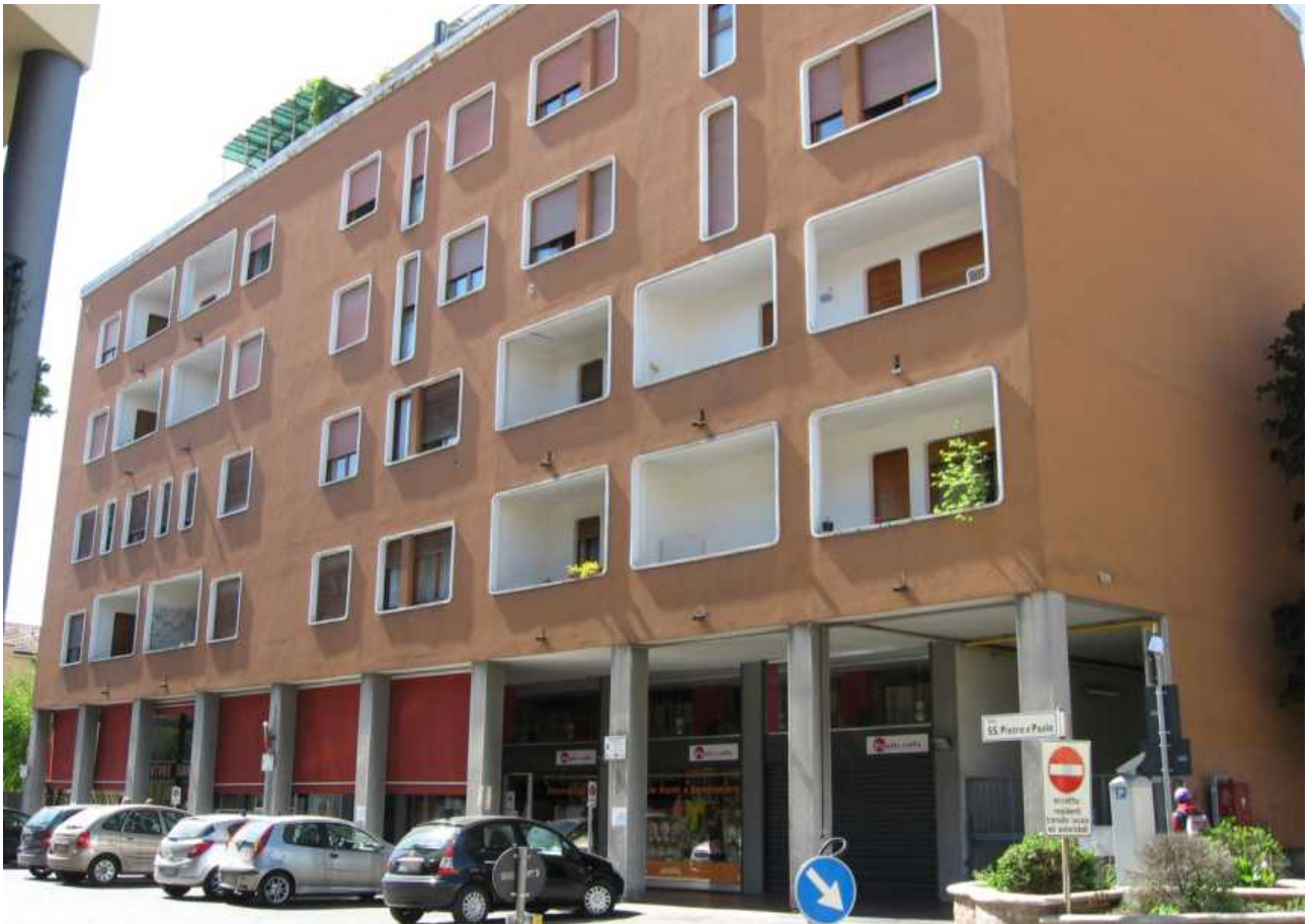
Via Santi Pietro e Paolo